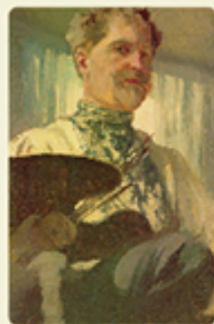
《パレットを持った自画像》