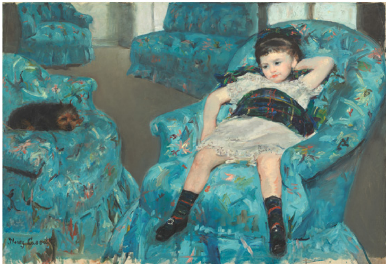
メアリー・カサット『若い子の椅子のなかの犬』1879年 油彩・カンヴァス National Gallery of Art, Washington / Collection of Mr. and Mrs. Paul Mellon