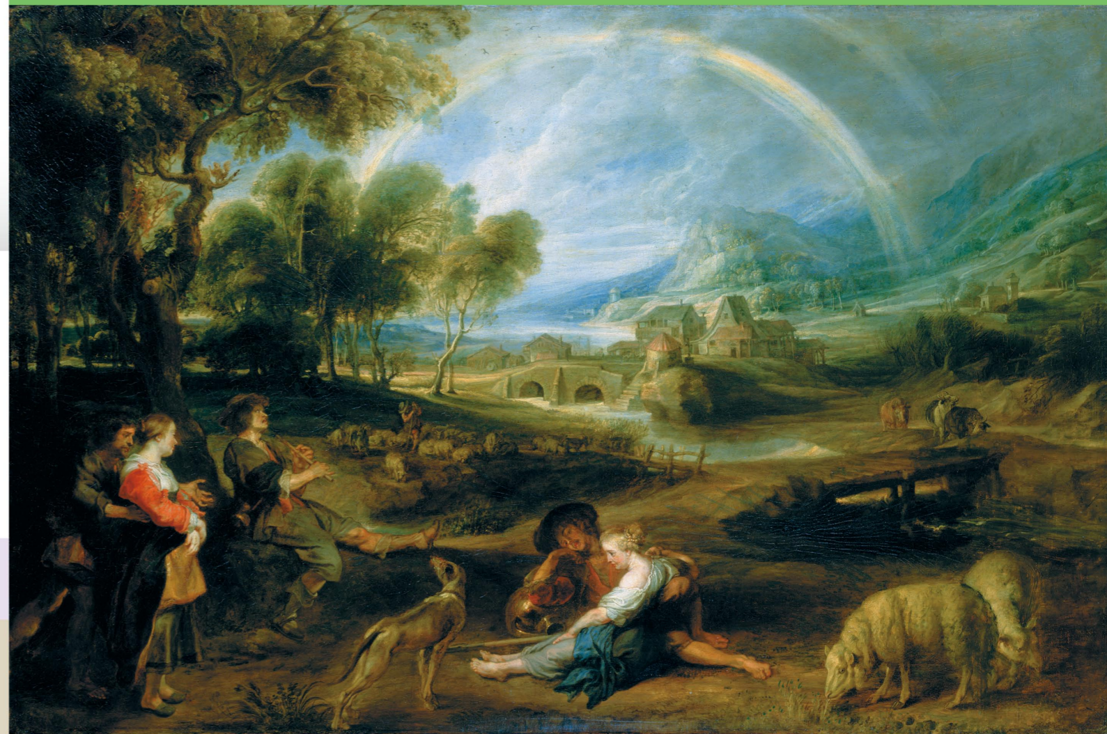
ペーテル・パウル・ルーベンス 《虹のある風景》1632頃-1635年