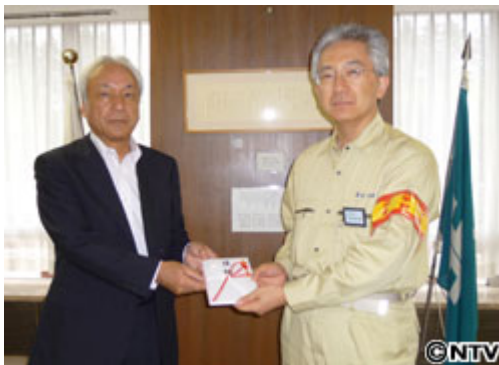
榑崎憲二・テレビ岩手社長（左） 達増拓也・岩手県知事（右）

日本テレビなど全国 31 社で組織される「24 時間テレビ」チャリティー委員会は、本日、東日本大震災被災地への第三次支援として、岩手県、宮城県、福島県、青森県、栃木県に合計 3 億 2,000 万円を贈呈しました。第一次支援から今回の第三次支援までを合わせて、これまでの支援総額は 11 億 5,000 万円となります。