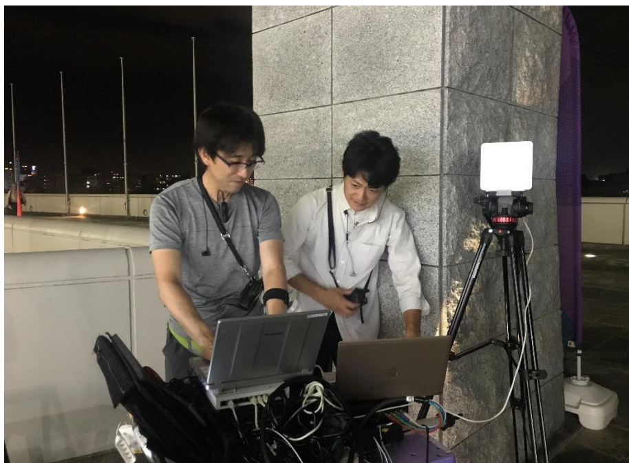
(4K映像を5Gプレサービス対応端末にて伝送)