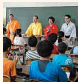
「笑点」メンバーの慰問