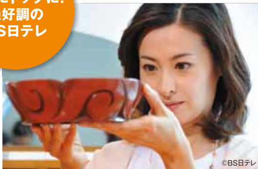
BS日テレ10月からの新番組「手わざ恋々～権れい名匠の里紀行～」毎週日曜日20:00～20:54 放送