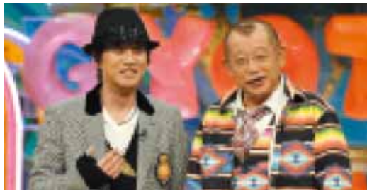
「ザ!世界仰天ニュース」 毎週水曜日21:00~21:54 放送

「2014 FIFAワールドカップブラジル アジア3次予選」ホームページより vs 北朝鮮 9月2日18:40~、vs ウズベキスタン 9月6日22:24~ 北朝鮮戦ではフルデジタル企画が満載。巨大ユニフォームをイメージしたHP、選手情報やフォーメーションに加えて、ハーフタイムクイズや投票企画も実施した「データ放送中継」が大好評でした。