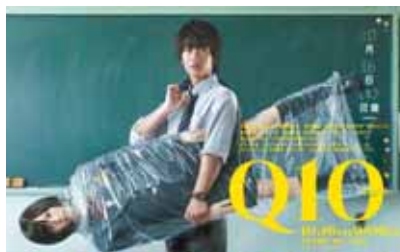
「 キョウト Q10」平成22年10月16日～12月11日 毎週土曜日21:00～ 放送