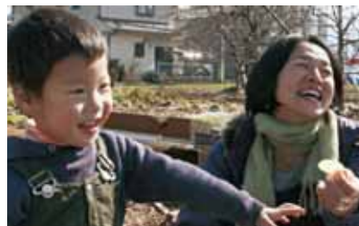
「リアル×ワールド/お母さんという生き方」 平成23年5月8日16:25～17:25 放送