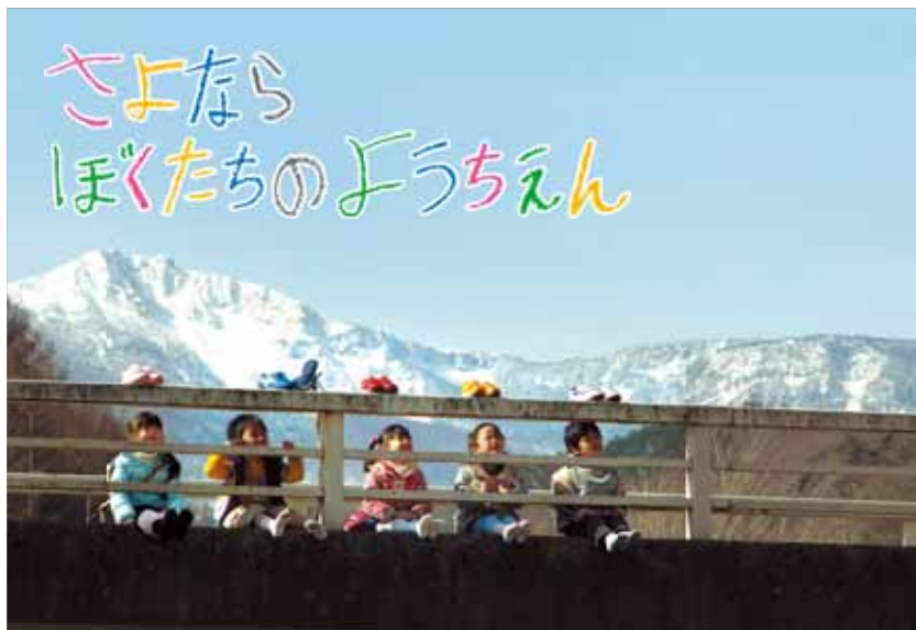
「さよならぼくたちのようちえん」平成23年3月30日21:00～23:09 放送

技術関連では「FPU波の光伝送による遠隔受信システムの開発」が〈民放連盟賞/技術部門最優秀〉に、「低遅延送り返し装置」が〈放送文化基金賞〉に輝いています。「巨人戦3D中継」とモバイル3Dコンテンツ「東北2011魂の祭～笑顔で泣く～」も〈国際3Dアワード〉を同時受賞しました。