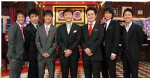
「しゃべくり007」 毎週月曜日22:00~22:54 放送