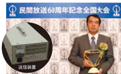
「FPU波の光伝送による遠隔受信システムの開発」受賞者 中継電波受信で威力を発揮! 保守性や安全性も向上します。