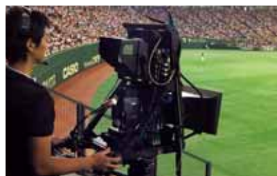
「巨人戦3D中継」日テレG+LIVE IN 3D 「巨人 vs 広島」プロ野球初の3D生中継