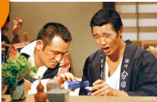
テレビに残る傑作ドラマ「前略おふくろ様」(写真上)・「池中玄太80キロ」や、「3か月連続人気女優特集」なども放送。

シーエス日本はSD画質からHD画質への比率を高める中、「日テレプラス」もマスターのHD化が完了。往年の名番組やドラマも数多く放送しています。